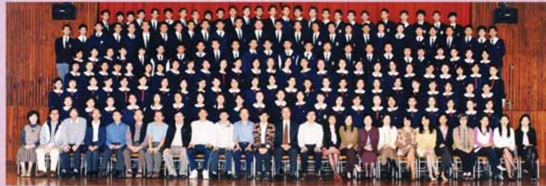
2001-2002 Form 7