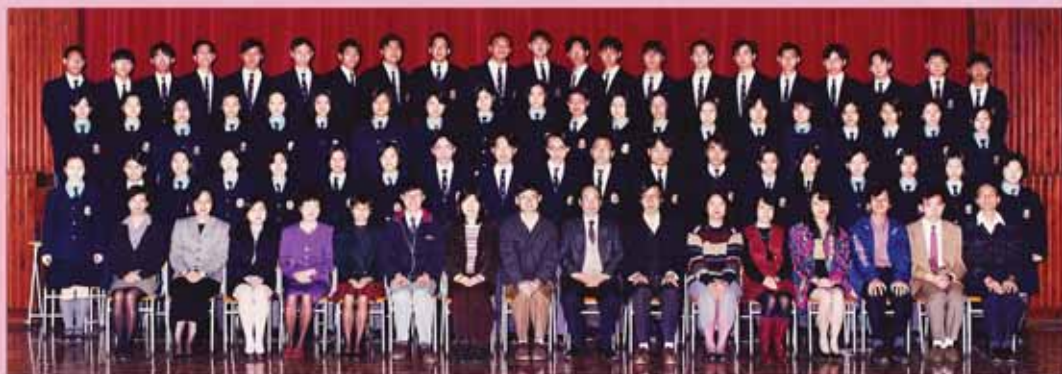
1997-1998 Form 7