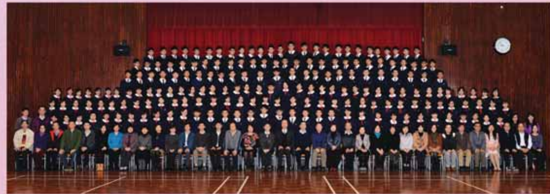
2011-2012 Form 7