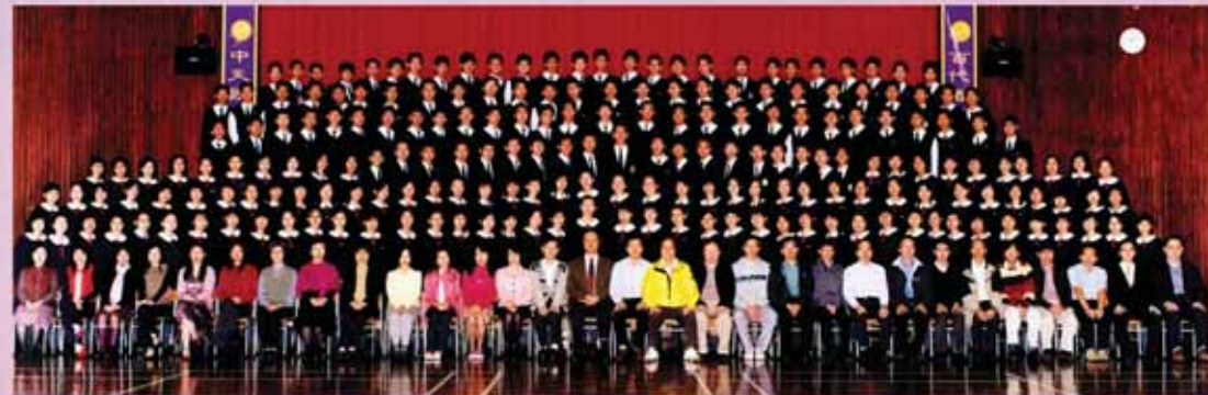
2003-2004 Form 7