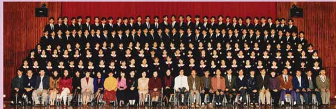
1992-1993 Form 7