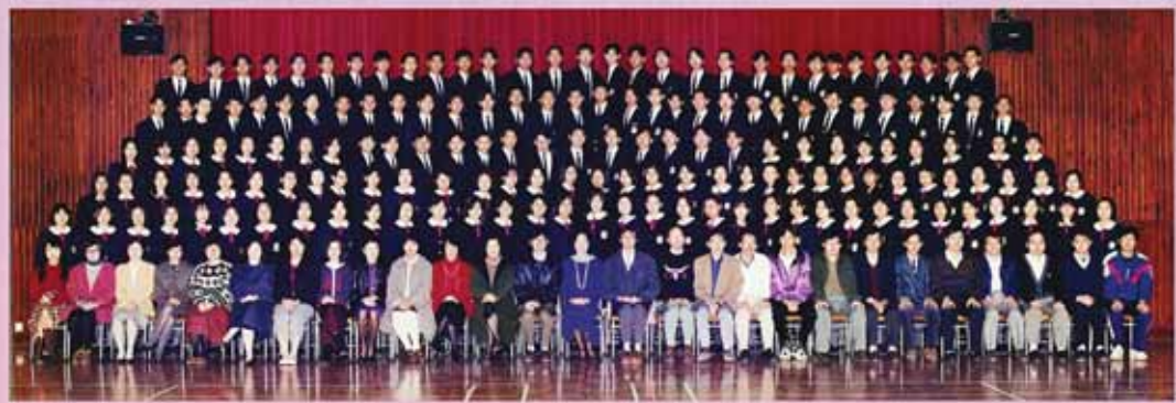
1995-1996 Form 5