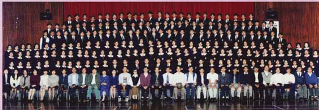
1996-1997 Form 7