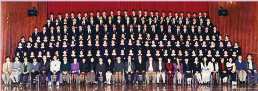
1997-1998 Form 5