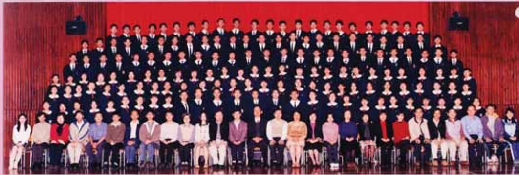
2004-2005 Form 5