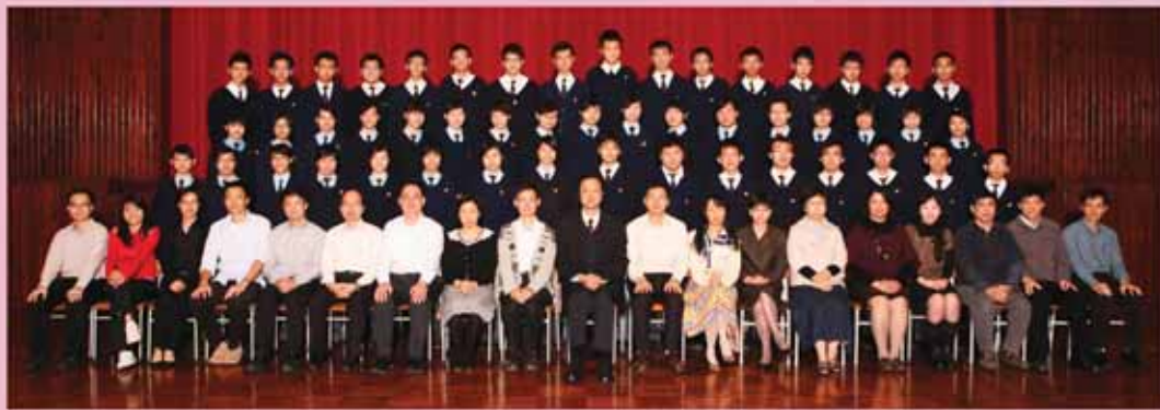
2008-2009 Form 7