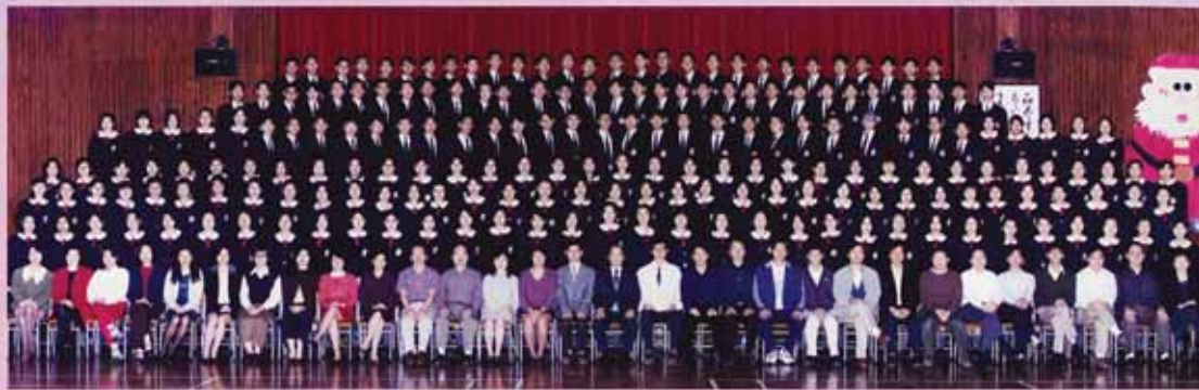
1999-2000 Form 5