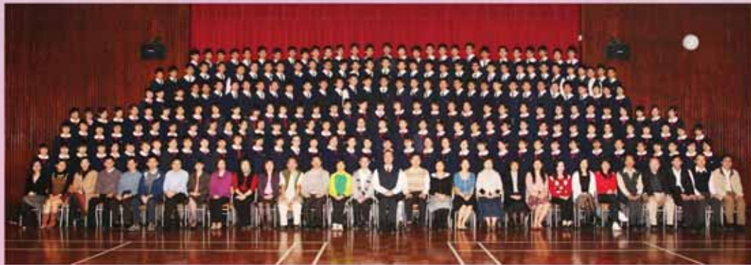
2008-2009 Form 5