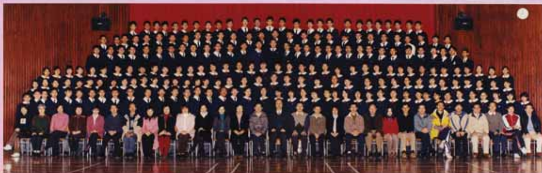
2006-2007 Form 5