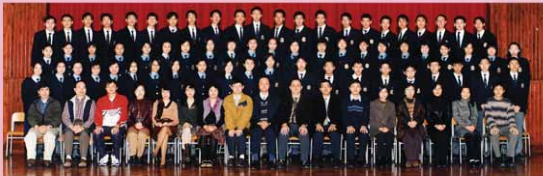
2002-2003 Form 7