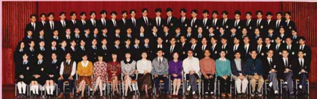
1993-1994 Form 7