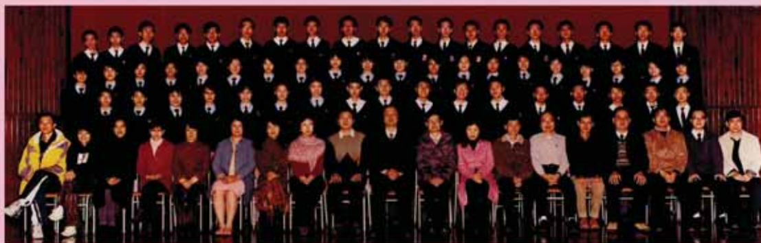
2006-2007 Form 7