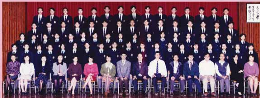
1999-2000 Form 7