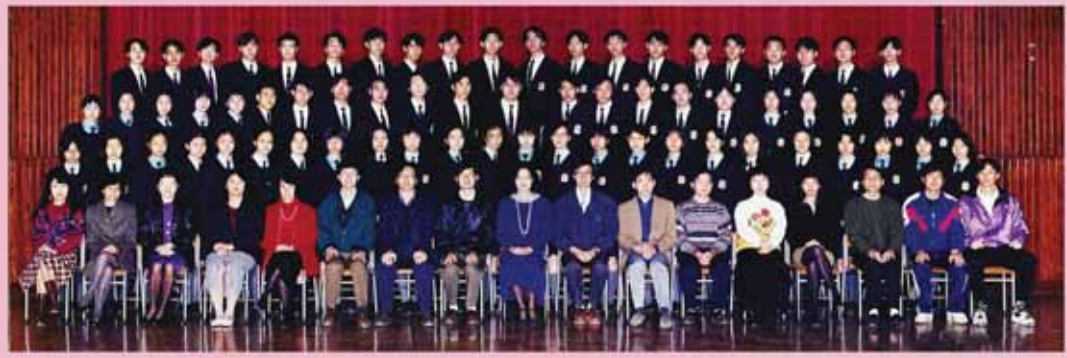
1995-1996 Form 7