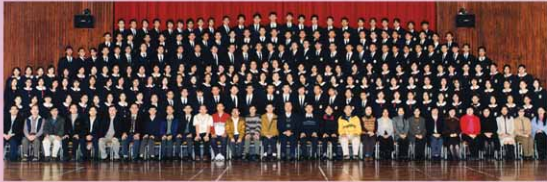
2002-2003 Form 5