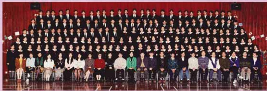
1994-1995 Form 7