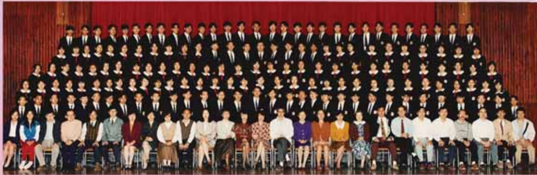
1993-1994 Form 5