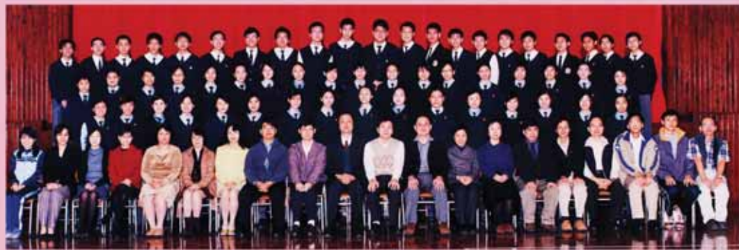
2004-2005 Form 7