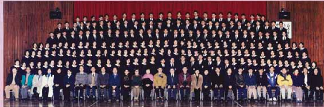
1998-1999 Form 7