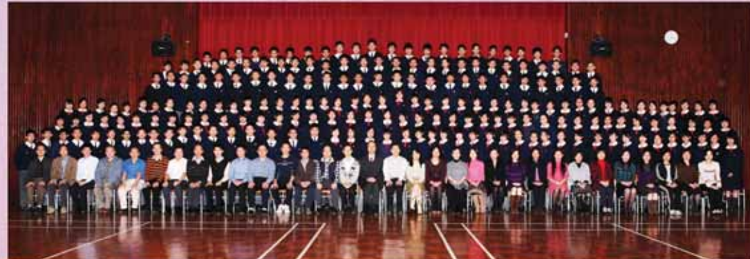
2007-2008 Form 7